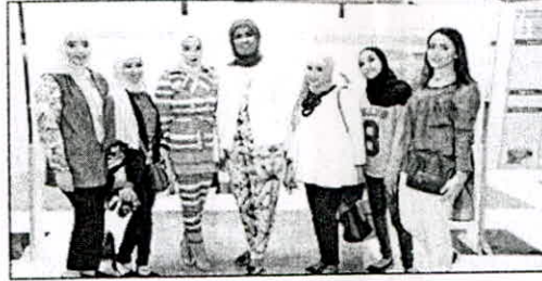
• مجموعة من المشاركات في المعرض