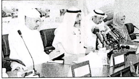
المندوبون في المؤتمر الصحافي

وسوف يقام الملتقى الاول للاتصالات تحت عنوان «الرؤية المستقبلية لتخصصات الاتصالات في ضوء الخطة الانمائية للكويت» والذي سيعقد في 5 ابريل المقبل ويستمر لمدة ثلاثة ايام بالمعهد العالي للاتصالات والملاحة بالمجمع التكنولوجي الطبي بمنطقة الشويخ.