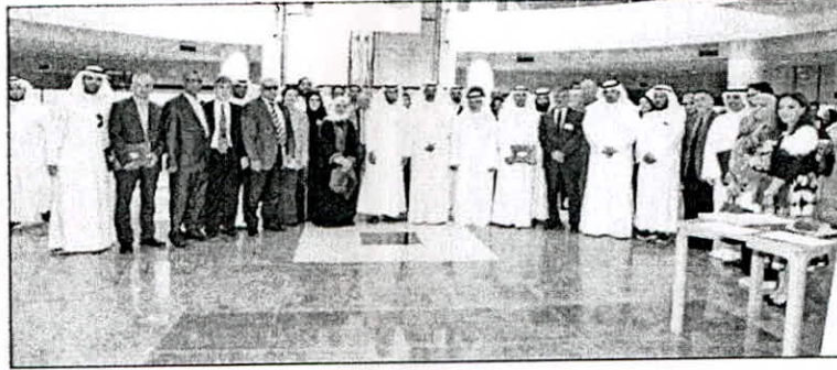
• المشاركون في المعرض